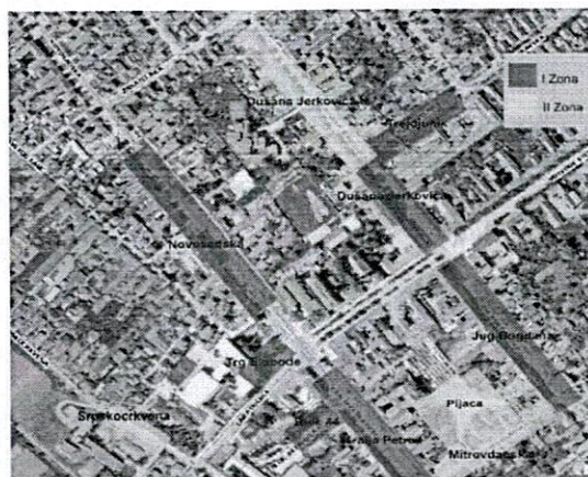
Слика: Зонирано подручје насељеног места Инђије

Свака зона је видно обележена саобраћајним знаком и додатном таблом која показује у којој се зони налазите. Наплата паркирања се врши од 7 до 21 радним данима, а суботом од 7 до 14 часова. Недељом и државним празницима се паркирање не наплаћује.