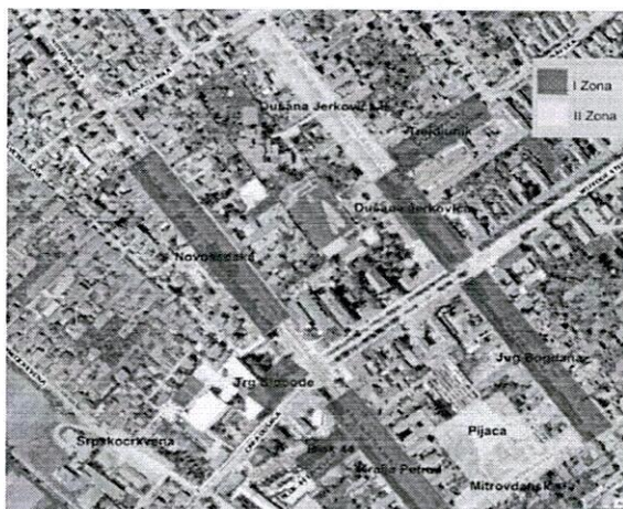
Слика: Зонирано подручје насељеног места Инђије

Свака зона је видно обележена саобраћајним знаком и додатном таблом која показује у којој се зони налазите. Наплата паркирања се врши од 7 до 21 радним данима, а суботом од 7 до 14 часова. Недељом и државним празницима се паркирање не наплаћује.